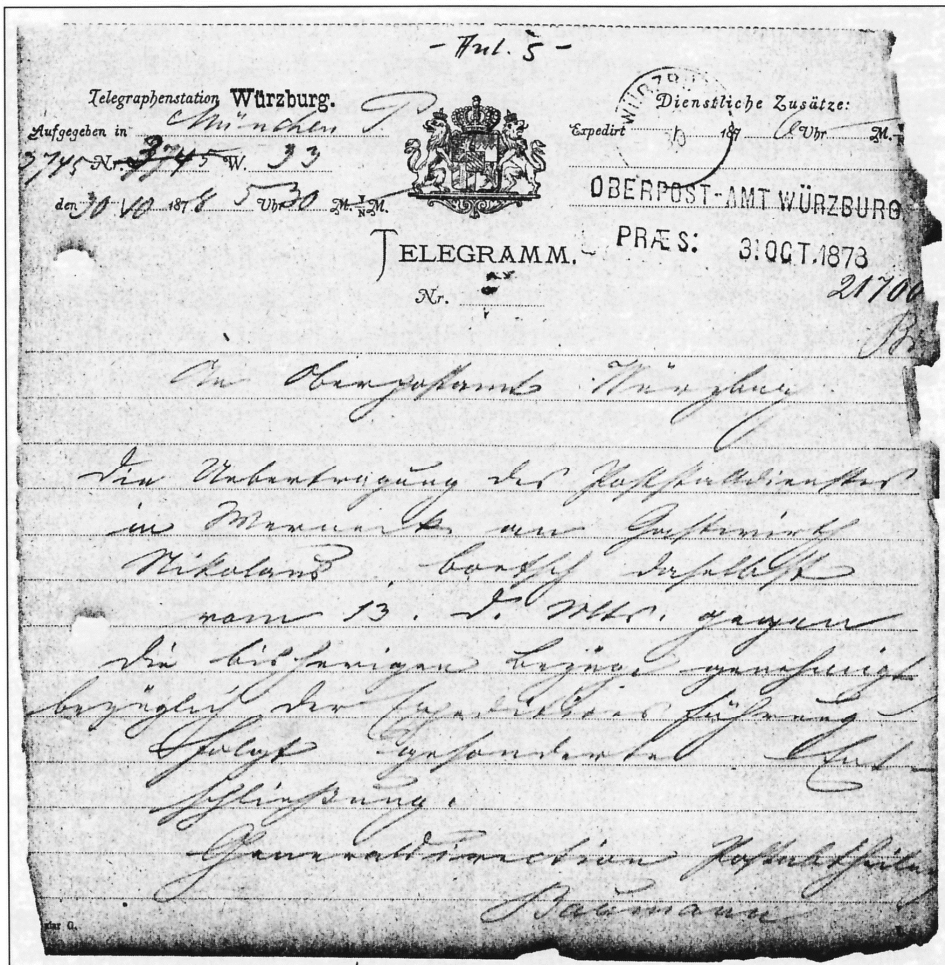
Telegraphische Mitteilung der Generaldirektion München vom 3. Oktober 1878: