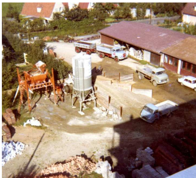
Das Lagergrundstück Am Ring in den 1960er Jahren