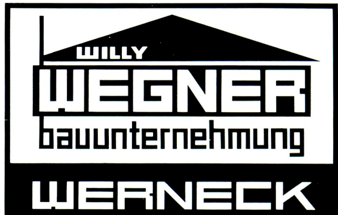
Werbeanzeige von 1972