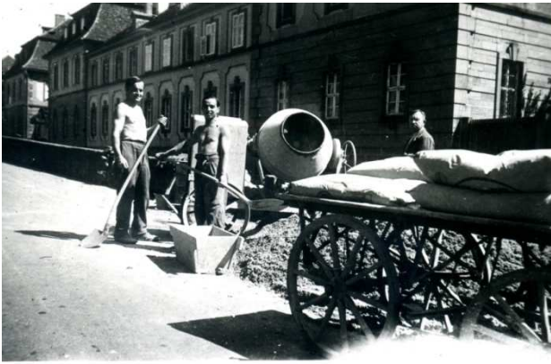
Belgische Kriegsgefangene vor dem Schloss