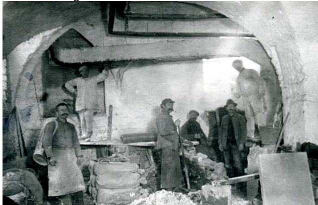
Maurer der Firma Wegner im Einsatz