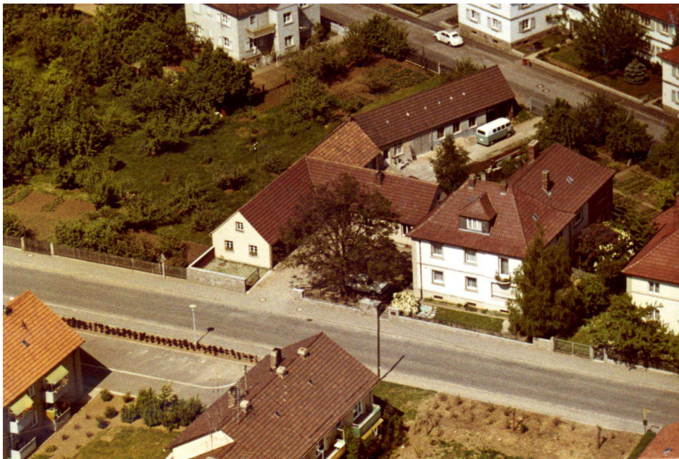
Firmensitz in den 1970er Jahren