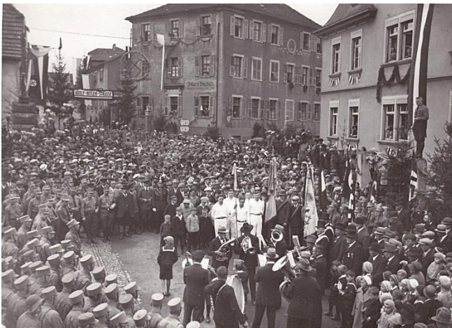
Blick auf die Adolf-Hitler-Straße (im Hintergrund; heute Schönbornstraße)

Nur gut zwei Monate später traten in den Gemeinderatssitzungen vom 7. April und 10. Juni 1933 von den ursprünglich 15 Gemeinderatsmitgliedern sechs „aufgrund politischer Umwälzungen“ zurück. In der Sitzung vom 7. April wurden „anlässlich der nationalen Erhebung zum steten Andenken, Herr Reichspräsidenten von Hindenburg und Herr Reichskanzler Adolf Hitler zu Ehrenbürgern der Gemeinde Werneck“ ernannt. Zugleich wurde aus der Anlage um das neue Schulgebäude die „Hindenburg-Anlage“, die sog. Hauptstraße die „Adolf-Hitler-Straße“ und die sog. Zeuzlebener Straße die „Horst-Wessel-Straße“. Den Antrag der Baugenossenschaft auf Umbenennung der Straße der Genossenschaftssiedlung auf den Namen des Gründers „Friedrich-Vogel-Straße“ (einem begeisterten Parteimitglied) nahm der Gemeinderat einstimmig an.