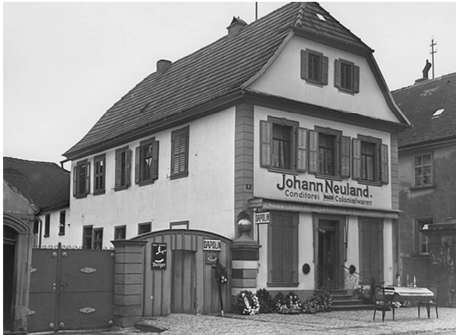
„Kaufhaus Neuland mit Sarg von Lina Neuland 1918 bei der Grippe Seuch gestorben.“

Aufmerksam auf diese Epidemie und ihre Folgen für Werneck wurde der Historische Verein durch dieses Foto und vor allem die Beschriftung auf der Rückseite: