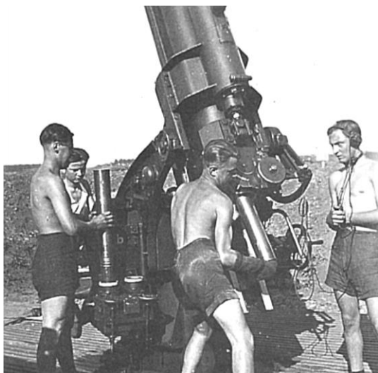
Soldaten an einer der Flak-Kanonen

Hauptursache, dass es Ettleben so hart traf, war die sich im Norden des Ortes befindliche Flakstation zur Verteidigung Schweinfurts. Diese hatte wohl den Befehl, „bis zum letzten Schuss“ zu kämpfen und beschoss deshalb am 6. April 1945 massiv amerikanische Panzer im sieben Kilometer entfernten Schwanfeld. Auch die am folgenden Tag in Werneck eingerückte amerikanische 12. US-Panzer Division wurde massiv angegriffen.