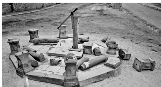
Der zerstörte Dorfbrunnen

Die Bilanz der beiden Tage war verheerend. Ettleben war zu 80% zerstört, 46 Wohnhäuser, 59 Scheunen und 47 Stallungen waren total zerstört, weitere 150 Gebäude zum Teil schwer beschädigt worden, darunter das neue Schulhaus, das Rathaus mit großen Teilen des Gemeindearchivs und der stark einsturzgefährdete Kirchturm, aus dem heraus deutsche Soldaten geschossen hatten. 350 Stück Vieh, unzählige Schweine und fast alle Kleintiere waren umgekommen.