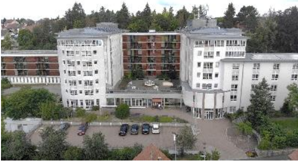
Aufnahme aus dem Jahr 2020

Im November 2004 begann der jetzige An- und Umbau. Die beiden Häuser des Erweiterungsbaus mit insgesamt 55 Betten wurden Ende Mai 2006 bezugsfertig. Nach Abschluss der Sanierung verfügt das Heim nun über 215 Pflegeplätze. Im Juli 2008 wurden die umfangreichen Umbau- und Erweiterungsarbeiten komplett abgeschlossen.