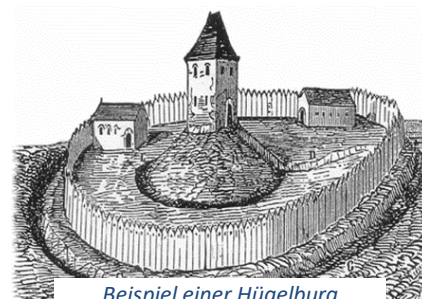
Beispiel einer Hügelburg (Altenholz in Schleswig-Holstein)

Die Burg durchbrach die Kette staufischer Besitzungen, die sich, vom Steigerwald ausgreifend, in nördlicher Richtung bis Schweinfurt