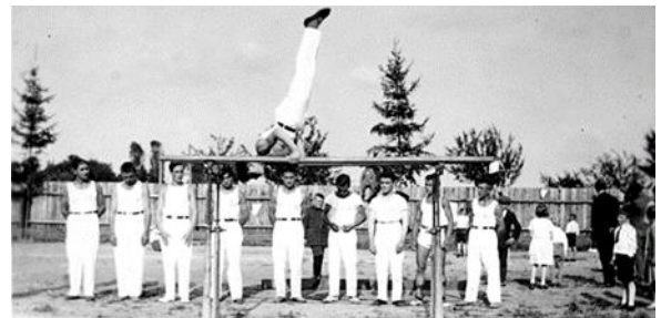
Turnvorführungen waren Teil des Eröffnungsprogrammes