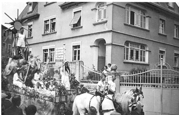
Der Festzug durch die Straßen Wernecks

Wertalzeitung 2.7.1932