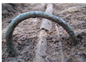
Ein Unterarmknochen mit einem Bronze-Armreif