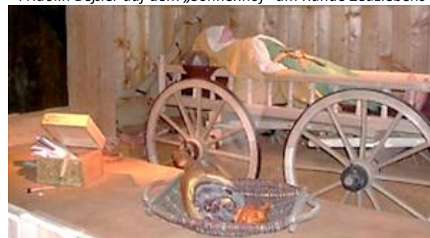
Ein Nachbau des „Fürstinnengrabes“ im Freilandmuseum Bad Windsheim.

Im November 2022 wurden am Rande von Erläben Spuren eines keltischen Grabgartens gefunden, der zu den größten Bayerns zählt.