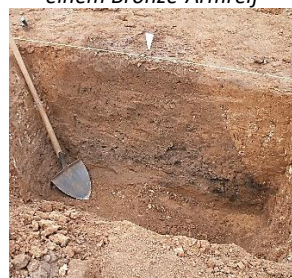
Verfärbungen einer Kegelstumpfgrube