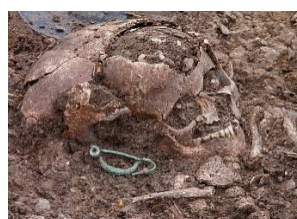
Ein Schädelfragment mit einer Bronze-Fibel