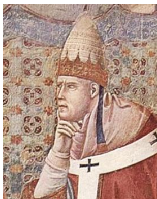
Papst Honorius III.