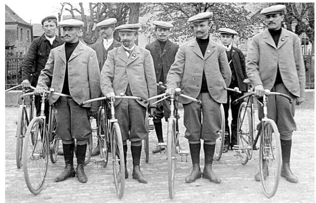
Radfahrergruppe um 1905 am heutigen Balthasar-Neumann-Platz