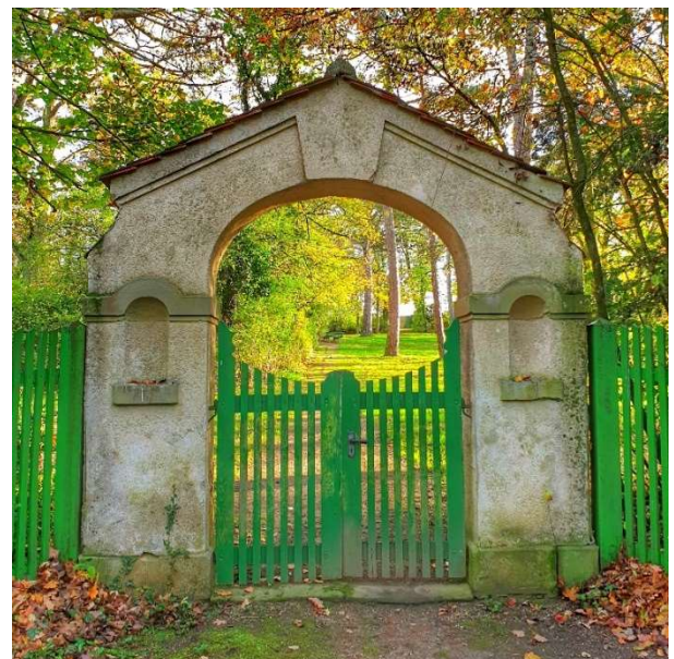
Das nördliche Eingangstor

Quellen: Manfred Fuchs: Der Waldfriedhof von Schloss Werneck, Bd. 48 der Landeskundlichen Schriftenreihe zur Geschichte des Oberen Werntals, 2024 / Krankenhausverwaltung Schloss Werneck – Archiv Patientenverwaltung