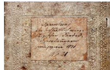
Umschlagvorderseite der Landesverordnungen-Sammlung

Hochinteressantes findet man in einem über 1700-seitigen Druckwerk, einer Sammlung der hochfürstlich-würzburgischen Landesverordnungen 7 aus dem Jahr 1776, der Amtszeit von Adam Friedrich von Seinsheim als Würzburger Fürstbischof. In diesem über vier Kilogramm schweren Wälzer sind Vorschriften und Verordnungen u.a. in Landgerichts-, Polizei-, Forst- und Militärangelegenheiten ab dem Jahre 1546 gesammelt, als Melchior Zobel von Giebelstadt Bischof von Würzburg war. Oftmals geht es um das Strafmaß für Verfehlungen, wobei die Strafen für Soldaten besonders vielfältig waren, denn über viele Seiten werden alle Straftaten aufgeführt, die im militärischen Bereich möglich waren. Auffällig ist, welcher Stellenwert die Religion, bzw. der katholische Glaube damals hatte. So wurde das Gotteslästern mit dem Tod durch das Schwert geahndet, wer den Sonn- oder Feiertagsgottesdienst mutwillig versäumte sollte an den Pfahl (Pranger) gestellet werden . Mit der Spitzrute gezüchtigt wurde, wer besoffen auf der Wacht erschien (so steht es tatsächlich in der entsprechenden Verordnung). Weitere Todesstrafen waren das Arquebusieren (Tod durch Erschießen) und die Hinrichtung durch den Strang. Meineidigen konnte die Zunge ausgerissen oder jeweils die vordersten Glieder der zum Schwur benötigten drei Finger abgeschnitten werden.